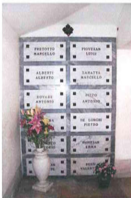
Loculi di caduti ponzanesi

Il 10 maggio 1976 nell'oratorio furono traslate le spoglie dell'on. prof. Giovanni Battista Cicogna. Davanti al loculo l'amministrazione comunale fece porre una lapide (foto sotto)