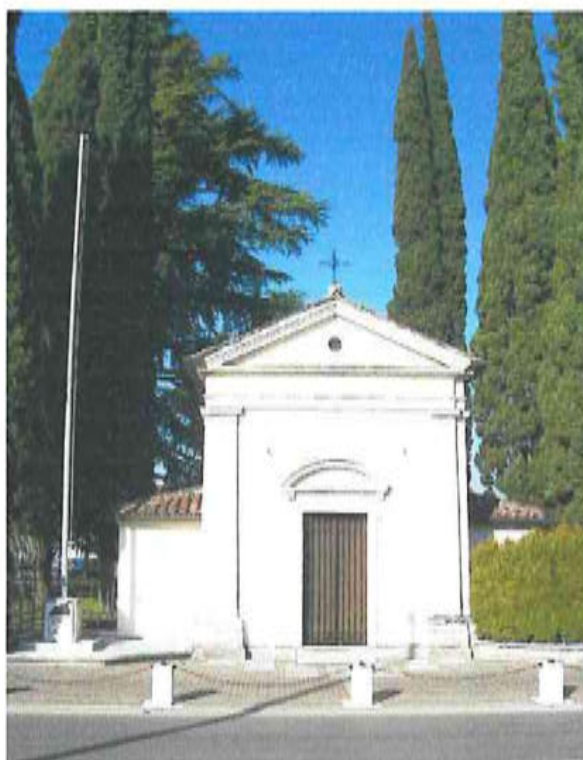
Oratorio di San Gaetano Thiene