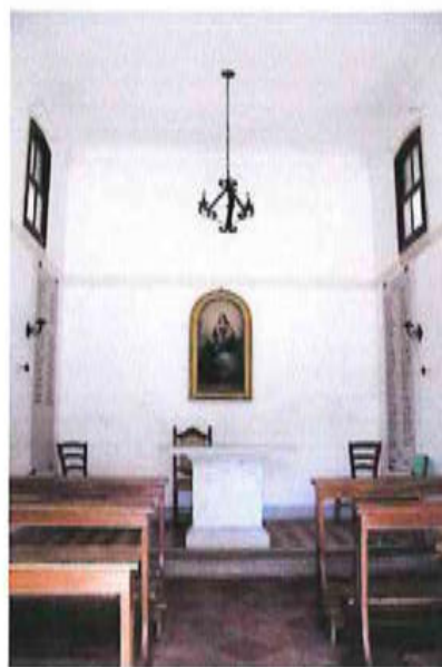
Interno dell'oratorio di San Gaetano