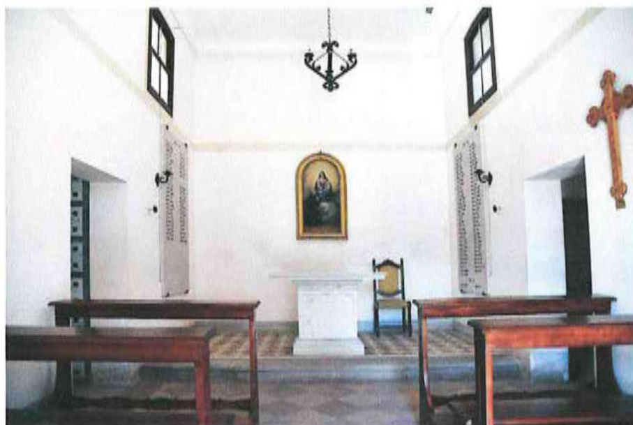
Interno dell'oratorio di San Gaetano (foto di Ettore Piovesan – anno 2018)

gurato San Gaetano Thiene in ginocchio davanti alla Madonna col Bambino in braccio (foto della copertina), attribuito al pittore Gian Battista Carrer 7 (1800 – 1868).