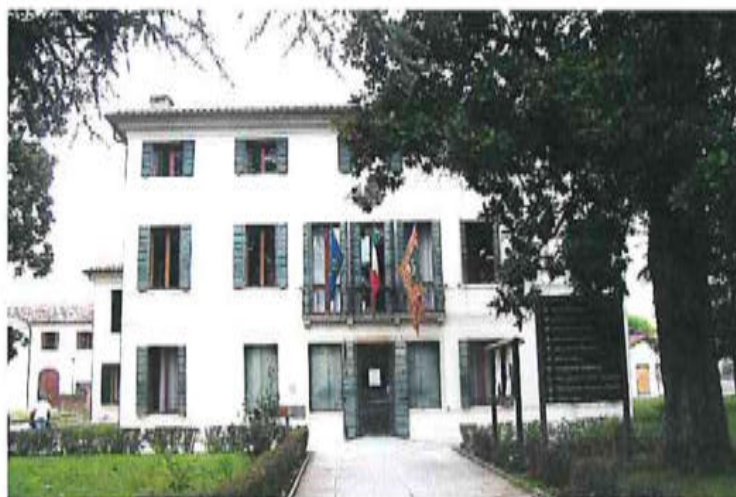
Palazzo Municipale (ex villa Cicogna)

Il comune ha come santo Patrono San Gaetano Thiene, al quale è dedicata una chiesetta (o oratorio), che si trova in zona Borgo Ruga 1 , nella frazione di Paderno.