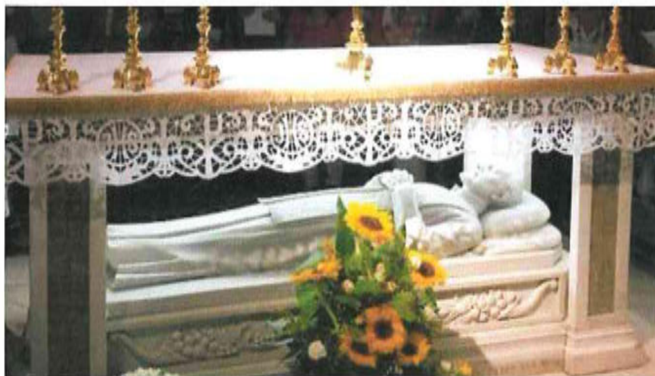
Altare contenente le spoglie di San Gaetano (Santuario di San Gaetano – Napoli)

O glorioso San Gaetano, che hai amato il Signore con cuore puro ed ammirabile distacco dal mondo, intercedi presso Dio, affinché, imitando le tue virtù, noi possiamo ottenere la salvezza eterna.