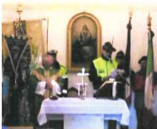
Foto di una celebrazione del 4 novembre

Sino a qualche anno fa anche il 4 novembre vi si svolgeva una cerimonia per ricordare tutti i caduti Ponzanesi. Dal 2016 questa celebrazione viene fatta a turno in una delle tre chiese parrocchiali del Comune.