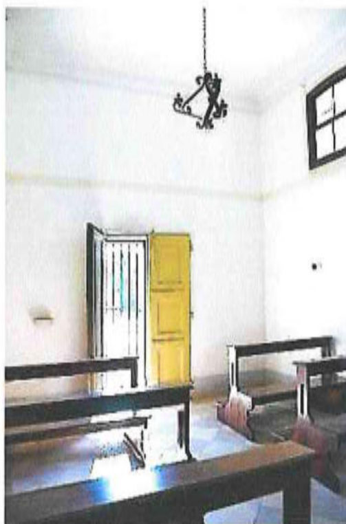
Interno dell'oratorio di San Gaetano