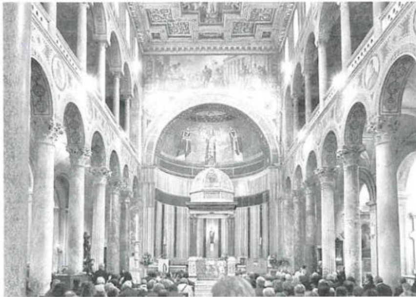
Interno della Basilica di Sant'Agnese fuori le Mura - Roma