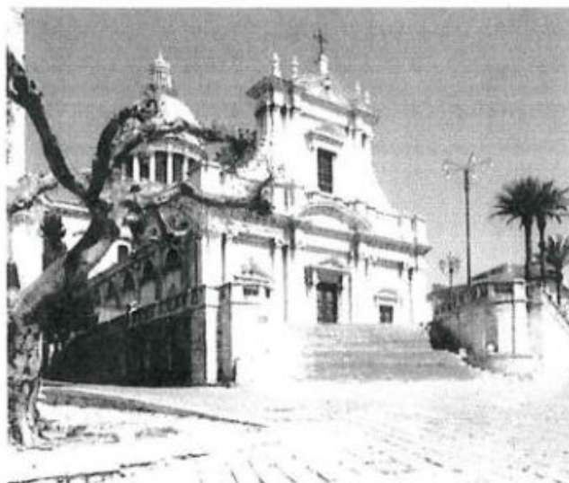
Chiesa SS. Annunziata (foto recente)