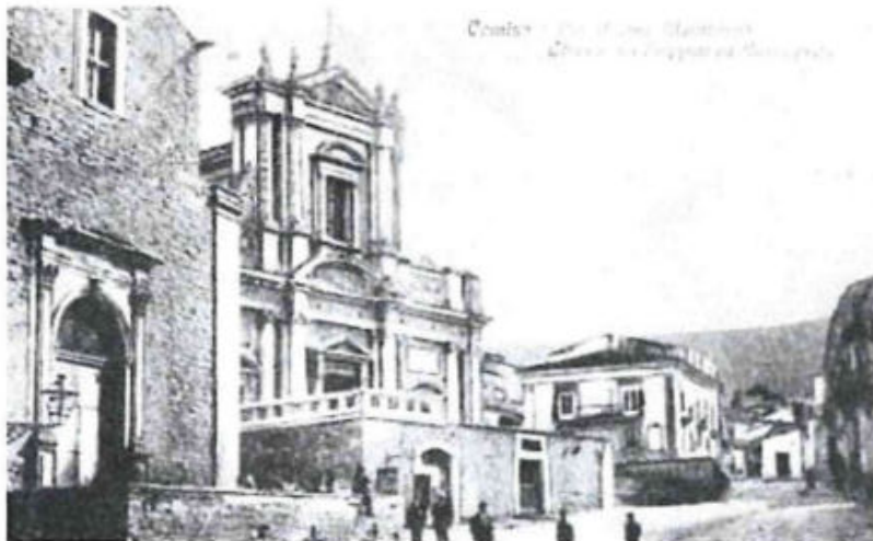
Chiesa SS. Annunziata (foto dei primi decenni del sec. XX)

Regina di clemenza, Tenera madre e pia, Dolcissima Maria, In Te speriam così.