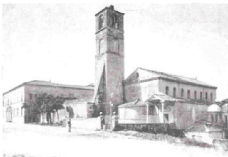
Vecchia foto della Basilica di Sant'Agnese fuori le mura - Roma

L'abito proprio delle Figlie di Maria è la veste bianca, cinta da fascia celeste pendente dal lato sinistro ed il manto bianco.