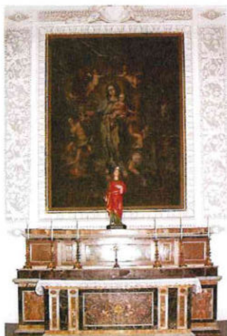
Altare della Madonna del Lume – Basilica della SS. Annunziata (Comiso)