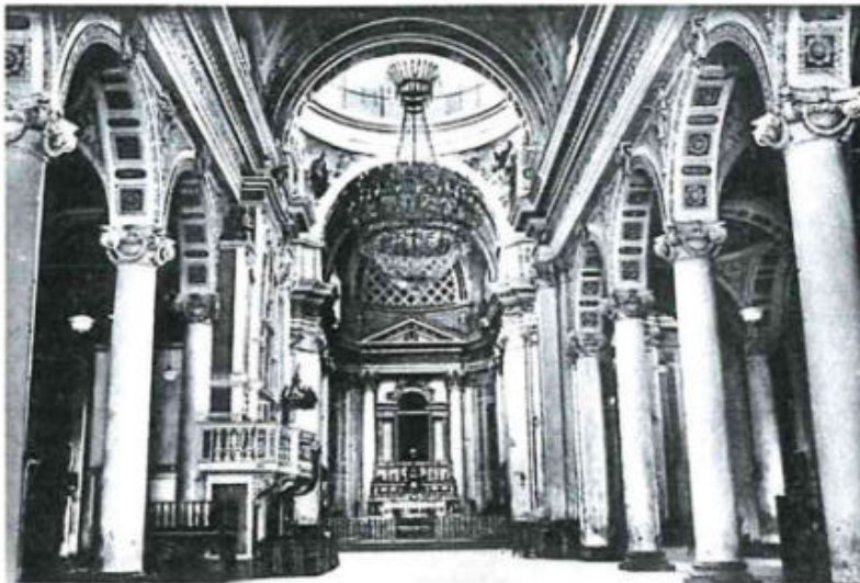
Interno della Basilica SS. Annunziata (foto della prima metà del sec. XX)