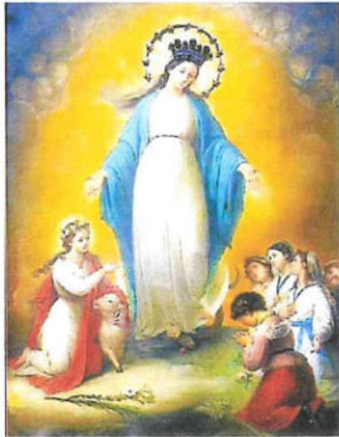
Quadro della Pia Unione delle Figlie di Maria nella Basilica di S. Agnese fuori le Mura - Roma