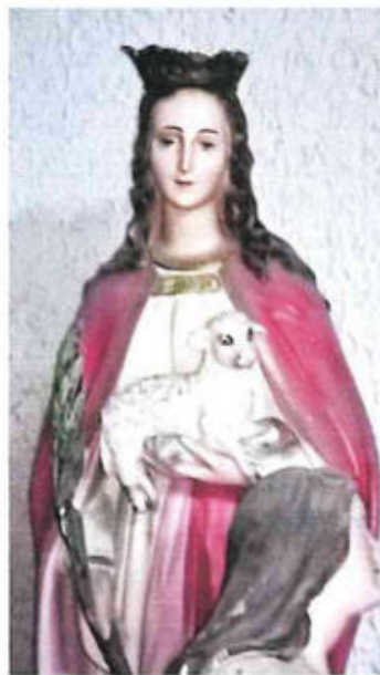
Statua in gesso di Sant' Agnese – Chiesa della SS. Annunziata (Comiso)