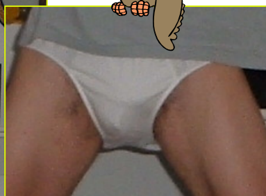
IL "ROCCO" DELLA KUMPA!