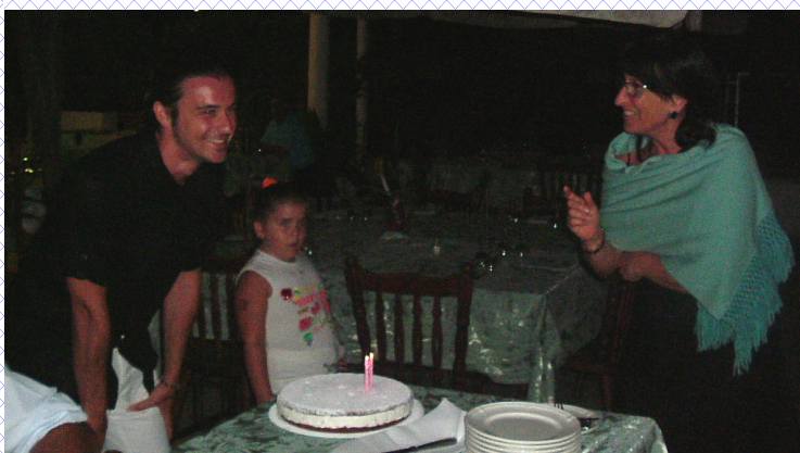
FOTO DEI FESTEGGIATI

...MA DOVEVO RESISTERE! ...MANCAVA ANCORA IL DOLCE!