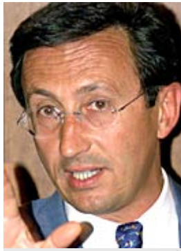
Partei­führer Gianfranco Fini: Trotz Erblast Anspruch auf das Außenamt?

Das Gegenstück zum Dröhner Bossi ist der 50-jährige studierte Pädagoge Gianfranco Fini: leise, höflich, mit wohlgeformten Sätzen meist unangreifbaren Inhalts - aber einer wenig Vertrauen erweckenden Vergangenheit.