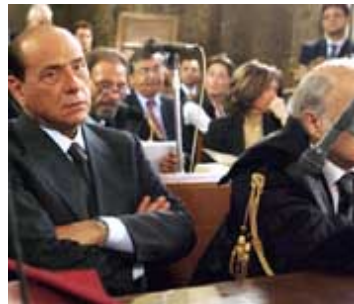
Angeklagter Berlusconi: "Logik von Putschisten"

Deren Ziel sei es nicht, "Gerechtigkeit zu schaffen", sondern diejenigen zu treffen, die Italien regieren, schimpfte Berlusconi. Vor allem die Richter seiner Heimatstadt Mailand gingen "mit der Logik von Putschisten" zu Werke. Dies müsse "im Interesse des Landes und seiner Bürger beendet werden".