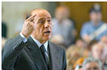
Berlusconi vor Gericht in Mailand

Zu Hause demontiert der reichste Mann Italiens die Justiz, macht sich das Fernsehen untertan, lässt sich vom Parlament Gesetze nach Bedarf schneiden. Nun wird Italiens Regierungschef Silvio Berlusconi Europa sechs Monate repräsentieren.