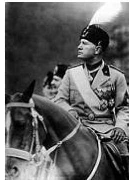
Mussolini (um 1930)

In Israel ist er weiterhin unerwünscht, obwohl seine Mitarbeiter seit Jahren in Jerusalem um einen Besuchstermin betteln. Nun hat Berlusconi Vizepremier, Kabinettsmitglied ohne Ressort, sogar gute Aussichten, Außenminister Italiens zu werden, wenn sein Chef des Doppelamts müde geworden ist. Die Ernennung dürfte in Brüssel zu einem neuen Aufschrei der Empörung führen.