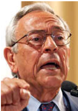
Verurteilter Cesare Previti

Anlass für die Kriegserklärung ist ein - erstinstanzlicher - Urteilspruch vom vergangenen Dienstag gegen den Verteidigungsminister in Berlusconis erster Regierung 1994, Cesare Previti. Elf Jahre soll der Parlamentarier in die Zelle, weil er Richter bestochen habe, urteilte das Gericht.