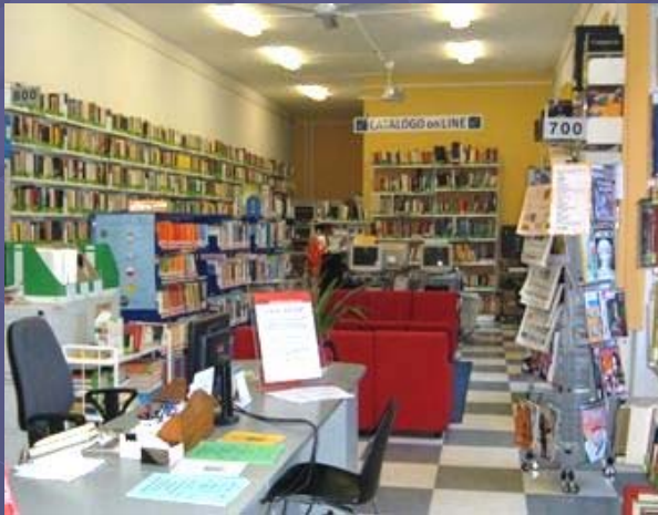
L'interno dell'attuale sede

Il tutto in uno spazio di 100 metri quadri