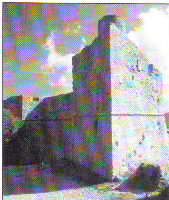
La Fortezza di Marciana