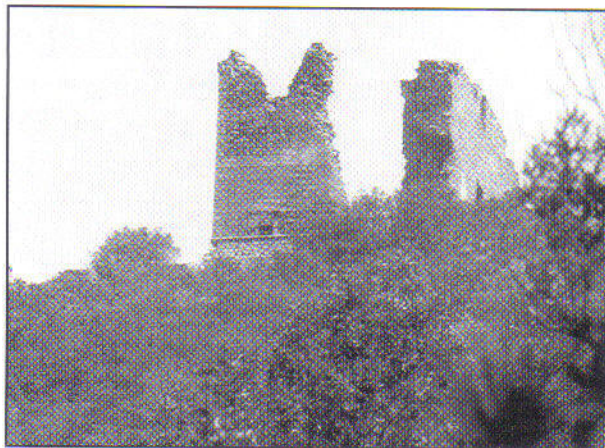
La Torre del Giove