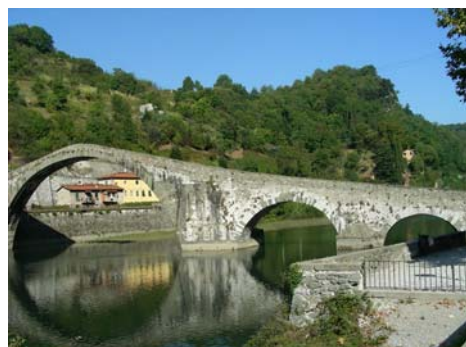
A sinistra: cena a Lucca e il Ponte della Maddalena a Borgo a Mozzano. A destra: le cave di marmo prima di Arni e una strada poco trafficata dell'appennino bolognese.