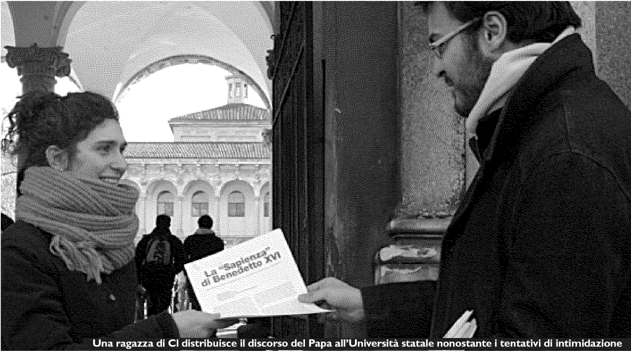
Una ragazza di CI distribuisce il discorso del Papa all'Università statale nonostante i tentativi di intimidazione