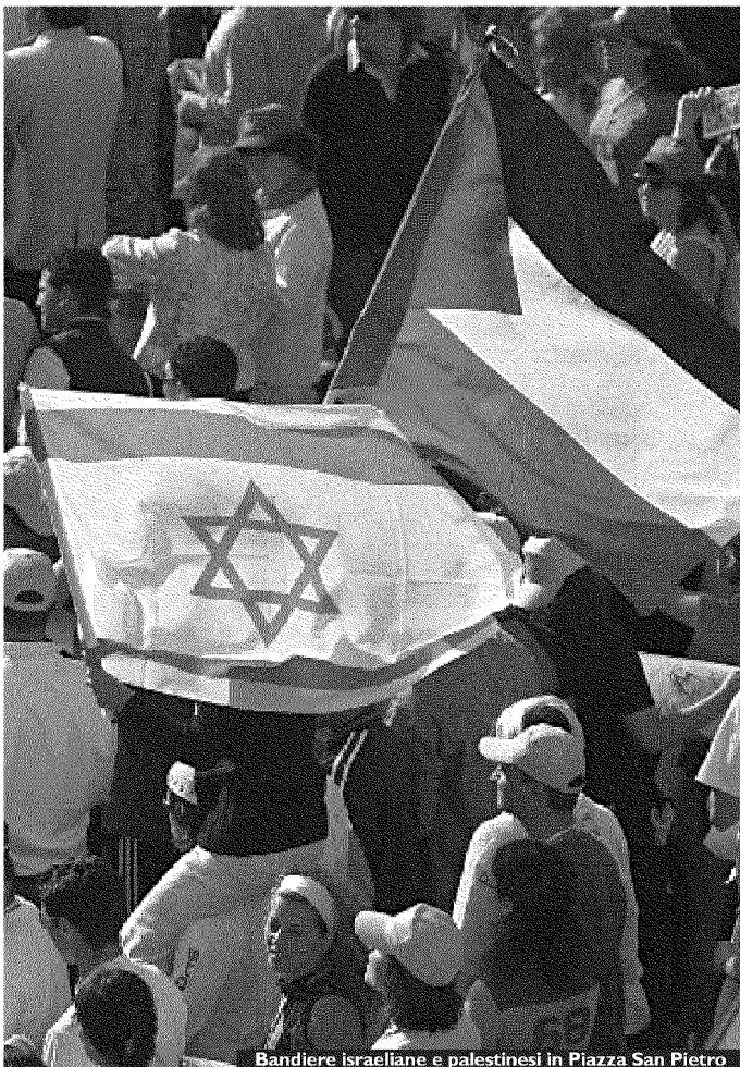
Bandiere israeliane e palestinesi in Piazza San Pietro