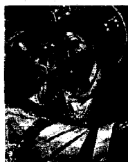
In alto, Trasfigurazione di Cristo di Andrea Previtali (1500 circa). Sopra, Il tradimento di Giuda , affresco bizantino della chiesa di San Clemente, Ohrid, Macedonia. In basso, Tempio mormone a Salt Lake City, nel Nevada.

dell'idolatria: bastava il buon senso, che i miei fedeli non hanno avuto. D'altronde, io ho solo chiesto che mi seguissero, non che mi raffigurassero o mi adorassero: ero l'Agnello di Dio, e mi hanno trasformato in un vitello d'oro. Però lei ha detto ai discepoli di andare e predicare ovunque la Buona Novella.