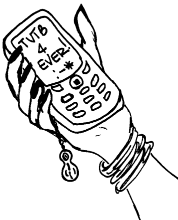
disegno di Giuliana Berardo