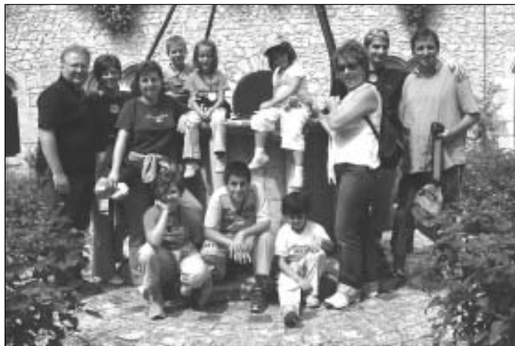
Il Gruppo Famiglia di Catanzaro