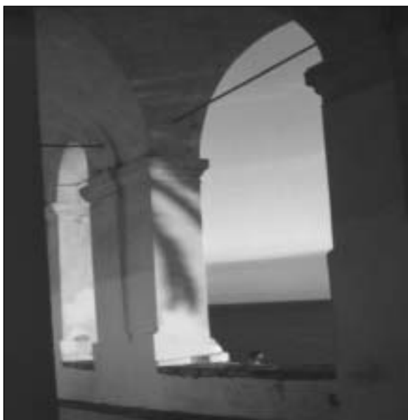
Porto Maurizio (IM): loggiato di S. Chiara

sacramento dei sacramenti. Attraverso la sua umanità egli si fa prossimo a noi, uno di noi, nostro compagno di viaggio. Facendosi uomo, Dio ci comunica se stesso, il suo amore, la sua vita. Dona se stesso. Il dono che ci fa è lo stesso donatore.