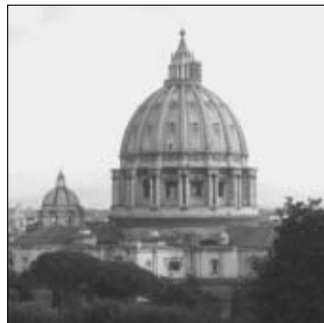
Roma: San Pietro