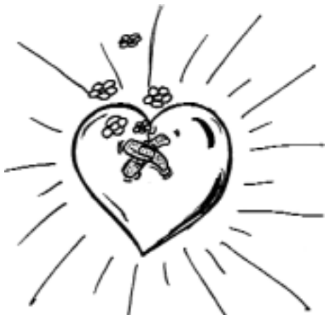
disegno di Giuliana Berardo

Si tratta di convivere con la fragilità. Convivere con i limiti non è un passivo rassegnarsi, anzi è il modo per affrontarli. Uno che non sa convivere con essi sarà rabbiosamente irritato o tenterà di sfuggire compensandosi in altri modi. La fuga e la rabbia non sono assunzione di responsabilità.