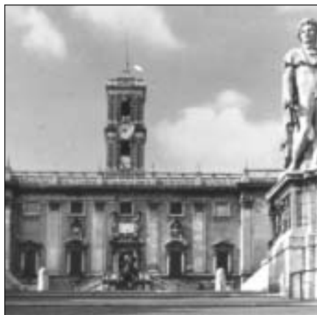
Roma: il Campidoglio

Tratto da: Enzo Bianchi, La differenza cristiana , Einaudi, Torino 2006, 8 euro.