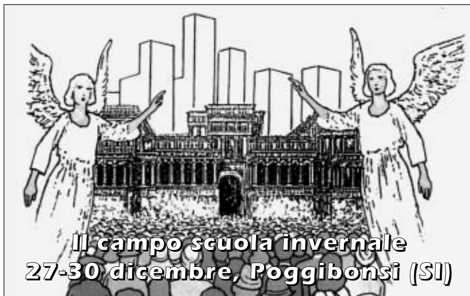
La nuova Gerusalemme. Da: "La Bibbia di Famiglia Cristiana"

Ripreso da "Settimana", EDB, Bologna 2006, n. 28-29, p. 10.