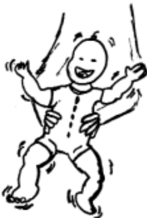
disegno di Giuliana Berardo

La virtù della speranza caratterizza la vita dei credenti in cammino verso il Regno di Dio. Essa non aliena dalla storia, ma al contrario permette di comprenderla come luogo di impegno e di anticipazione dell'esperienza dei valori del Regno. Una particolare responsabilità deve essere oggi attivata nella coscienza ministeriale dei sacerdoti a non abbandonare la famiglia a se stessa, ma a sentire forte l'invito del Direttorio di Pastorale Familiare ad "annunciare, celebrare, servire il Vangelo della famiglia". Sintesi a cura di don G.Franco Grandis.