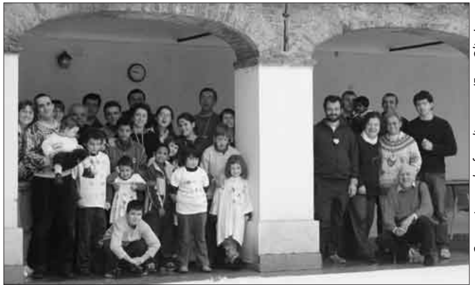
Campo invernale: foto di gruppo