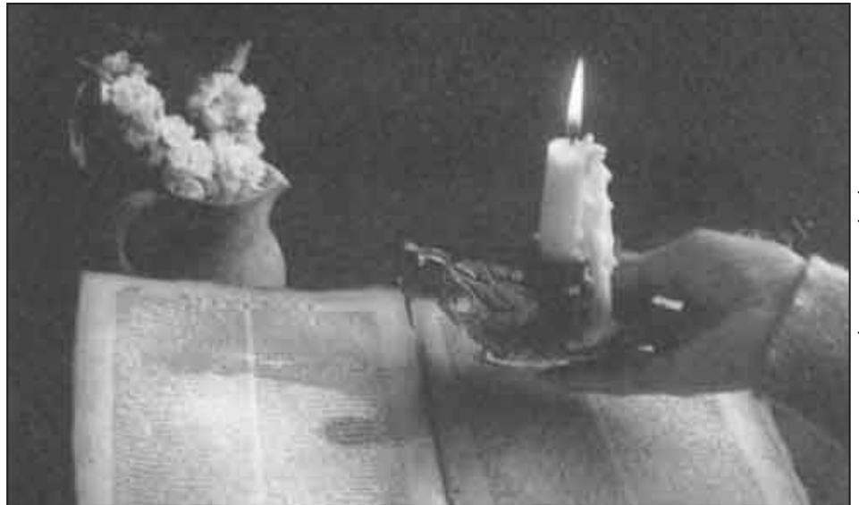
Da: Catechisti parrocchiali n. 2, 1996