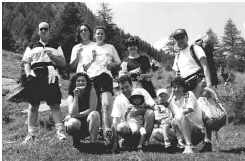
Campi estivi: la gita in montagna

Prenotatevi per tempo, così potremo realizzare meglio questo servizio