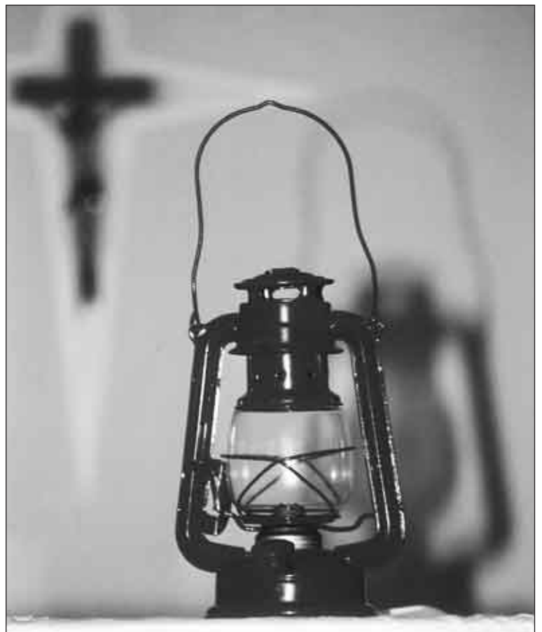
Campi estivi: il simbolo di un campo