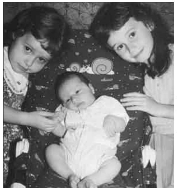
Sorelline e fratellino

*sacerdote, docente di Teologia Morale presso la Facoltà Teologica dell'Italia settentrionale, sez. di Torino (sintesi a cura della redazione).