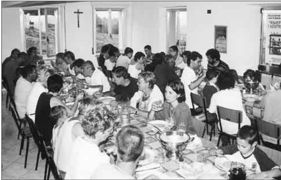
Campi estivi: il pranzo in comune

La nostra casa può essere grande o piccola, modesta o lussuosa ma la sua porta deve essere sempre pronta ad aprirsi a Dio che bussava.