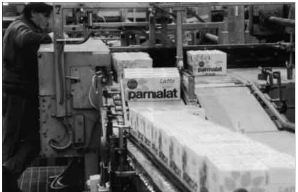
Una linea di produzione (da Città nuova, n. 2, 2004)

Dal settimanale "Vita" del 7 febbraio 2004