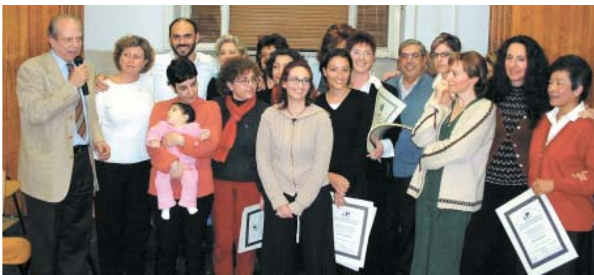
Diplomati Master in Counseling Professionale