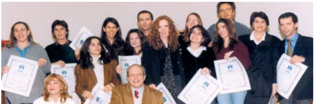
Diplamati Master in Counseling Professionale