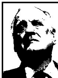
ALFREDO BIONDI deputato Forza Italia

Condannato definitivamente dalla Cassazione nel 2001 per abusivismo edilizio, per via di alcuni ampliamenti illeciti nella sua casa a Pantelleria; 10 giorni di arresto e 20 milioni di lire di ammenda, più "l'ordine di pristino dei luoghi". Cioè la demolizione delle opere abusive.