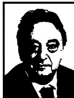
GIANNI DE MICHELIS eurodeputato Socialisti Uniti per l'Europa

Già sindaco di Agrigento, condannato definitivamente a 1 anno e 6 mesi per abuso d'ufficio finalizzato a favorire i costruttori abusivi in cambio di favori elettorali.