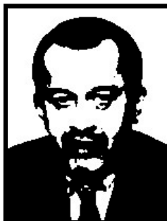
ROBERTO MARONI deputato Lega Nord e ministro Lavoro

1 anno e 4 mesi patteggiati per truffa ai danni del Ministero del Lavoro e della CEE per 474 milioni di lire in cambio di falsi corsi di qualificazione professionale per la sua azienda.