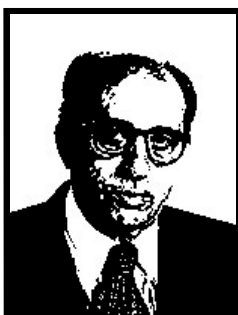
LINO JANNUZZI senatore Forza Italia

1 anno e 8 mesi definitivi per finanziamento illecito tangente Enimont, 2 mesi patteggiati per corruzione per fondi neri ENI.