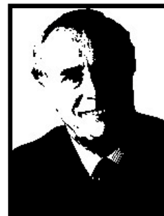
GIAMPIERO CANTONI senatore Forza Italia

1 anno e 6 mesi patteggiati a Milano per corruzione per le tangenti autostradali del Veneto; 6 mesi patteggiati per finanziamento illecito Enimont.