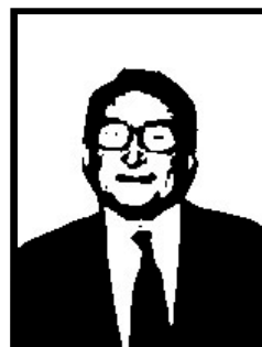
GIANSTEFANO FRIGERIO deputato Forza Italia

2 mesi patteggiati per evasione fiscale a Genova. La sentenza di condanna a suo tempo resa dal tribunale di Genova nei confronti di Alfredo Biondi è stata revocata in data 28 settembre 2001 per intervenuta abrogazione del reato.