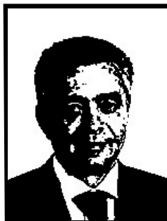
CALOGERO SODANO senatore Udc

Condannato definitivamente a 4 mesi e 20 giorni per resistenza a pubblico ufficiale durante la perquisizione della polizia nella sede di via Bellerio a Milano.