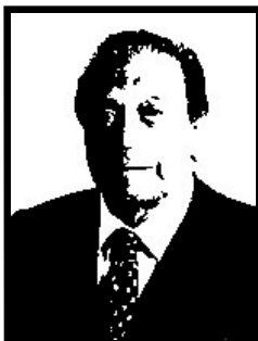
WALTER DE RIGO senatore Forza Italia

1 anno e 4 mesi patteggiati per truffa ai danni del Ministero del Lavoro e della CEE per 474 milioni di lire in cambio di falsi corsi di qualificazione professionale per la sua azienda.