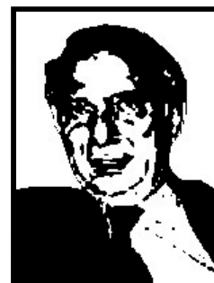
PAOLO CIRINO POMICINO eurodeputato Udeur

Condannato a Milano a oltre 6 anni di reclusione definitivi per le tangenti delle discariche (3 anni e 9 mesi, corruzione) e per altri due scandali di Tangentopoli (2 anni e 11 mesi per concussione, corruzione, ricettazione e finanziamento illecito).