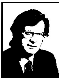
VITTORIO SCARBI deputato Forza Italia

Come ex presidente della Bnl in quota Psi, inquisito e arrestato per corruzione, bancarotta fraudolenta, ha patteggiato la pena e risarcito 800 milioni.