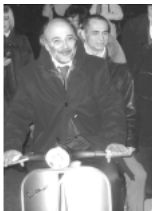
Il Sindaco in vespa

Voglio ricordare che il Dopolavoro Ferroviario si