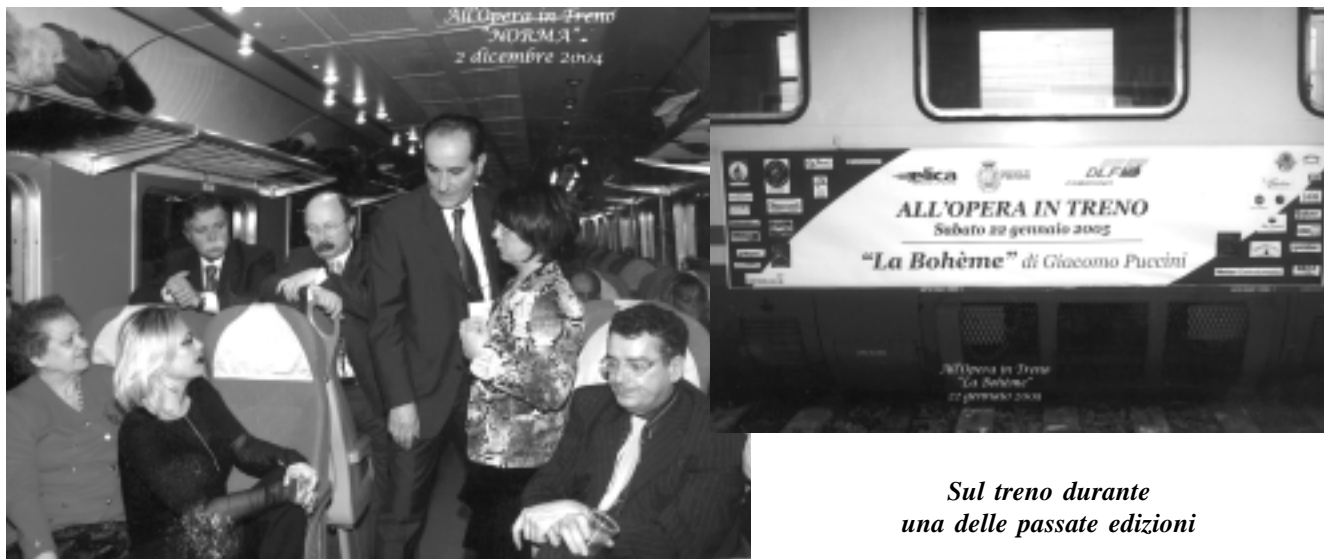
Sul treno durante una delle passate edizioni

Donizetti ha musicato su un libretto di Salvatore Cammarano. Massimiliano Pisapia e Dimitra Theodossiou, nuova stella del Metropolitan, ne saranno i protagonisti