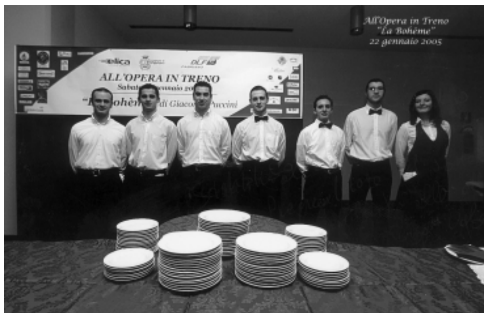
Lo staff di cucina pronto per i nostri partecipanti

è trasferito nella Stazione F.S. e qui potremo offrire tutte le informazioni necessarie e cominciare a ricevere le adesioni.