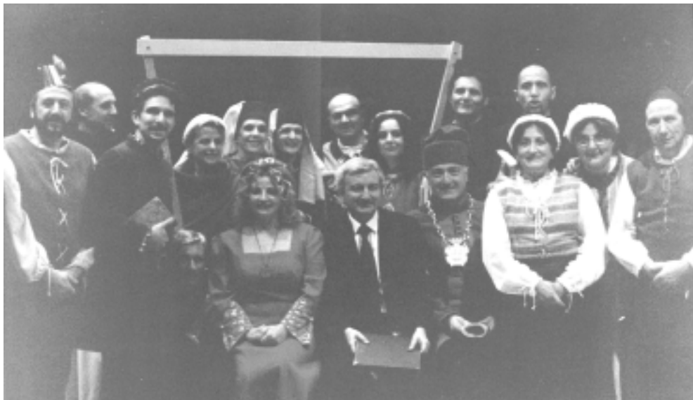
Lo staff al completo della "Compagnia dei Vicoli della Gioia"

Il 1° luglio, il nostro DLF ha partecipato alla 2° rassegna teatrale dialettale dei Dopolavori ferroviari con la commedia ELETTRA di Teseo Tesei, portata sulla scena dal noto gruppo amatoriale fabrianese "Compagnia dei Vicoli della Gioia".