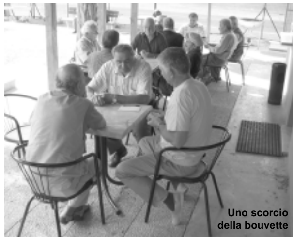
Uno scorcio della bouvette

Al circolo del tennis e delle bocce del DLF, nei rinnovati ed accoglienti locali dove "esercitare" il tempo libero con spazi all'aperto a disposizione e dove si integrano in maniera virtuosa le attività degli anziani con quelle dei giovani, i soci sono invitati a partecipare al torneo di Briscola. Premi per i primi: due agnelli e due casse di vini "cantine Mecella" Per i secondi: due prosciutti e due scatole di vini "Cantine Mecella", per i terzi e quarti due lonze, due salami di Fabriano e due scatole di vini "Cantine Mecella". Coppa al gruppo più numeroso, Premio speciale alla prima