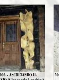
2008 - ASCOLTANDO IL SILENZIO (Gianangelo Longhini)