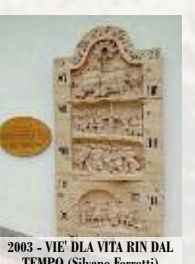
2003 - VIE DI LA VITA RIN DAL TEMPO (Silvano Ferretti)