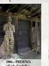
2006 - PRESENZA (Carlo Condello)