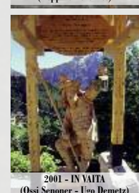
2001 - IN VAITA (Ossi Senoner - Ugo Demetz)