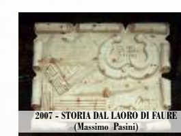
2007 - STORIA DAL LAORO DI FAURE (Massimo Pasini)