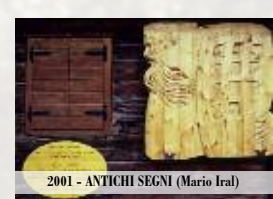
2001 - ANTICHI SEGNI (Mario Iral)