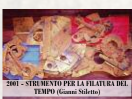
2001 - STRUMENTO PER LA FILATURA DEL TEMPO (Gianni Stiletto)