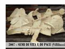
2007 - SEMI DI VITA E DI PACE (Vilibossi)