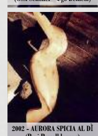
2002 - AURORA SPICIA AL DI (Pepi Pescoldrerung)

L'associazione CostaltArte presenta la dodicesima edizione della manifestazione "Una statua di legno, in una casa di legno, in un paese di legno", nella certezza di aggiungere un'altra trave a quella preziosa costruzione artistica, che ha ormai portato nel tessuto urbano del paese, accanto alle antiche case scurite dal sole, 33 opere di artisti italiani e stranieri.