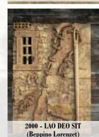
2000 - LAO DEO SIT (Beppino Lorenzet)