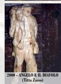
2000 - ANGELO E IL DIAVOLO (Titta Zasso)