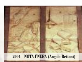
2004 - NOTA N'ERA (Angelo Bettoni)