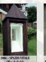
2006 - SPAZIO VITALE (Max Seibald)