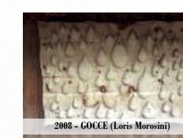
2008 - GOCCE (Loris Morosini)