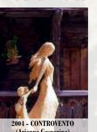
2004 - CONTROVENTO (Arianna Gasperina)