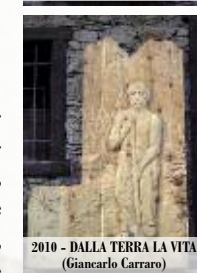
2010 - DALLA TERRA LA VITA (Giancarlo Carraro)