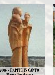
2006 - RAPITE IN CANTO (Danie Turchetto)