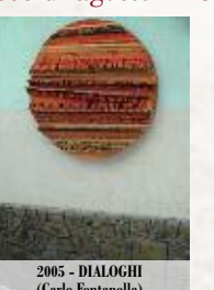
2005 - DIALOGHI (Carlo Fontanella)