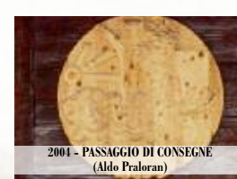
2004 - PASSAGGIO DI CONSEGNA (Aldo Praloran)