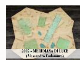
2005 - MERIDIANA DI LUCE (Alessandro Cadamuro)