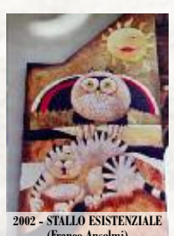
2002 - STALLO ESISTENZIALE (Franco Anselmi)