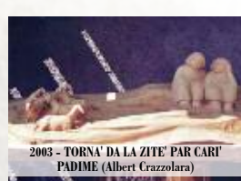
2003 - TORNA DA LA ZITE PAR CAR' PADIME (Albert Crazzolara)