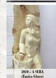
2010 - A SERA (Enrico Ghiso)