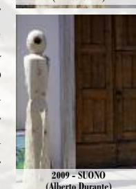
2009 - SUONO (Alberto Durante)