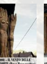
2008 - IL VENTO DELLE DOLOMITI (Peter Branstetter)