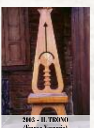
2003 - IL TRONO (Franco Vergerio)