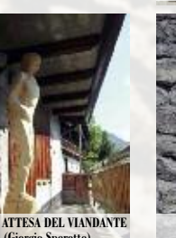
2009 - ATTESA DEL VIANDANTE (Giorgio Sperotto)