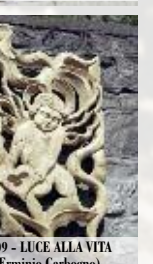
2009 - LUCE ALLA VITA (Ermino Carbogno)