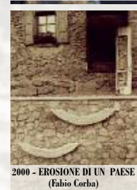
2000 - EROSIONE DI UN PAESE (Fabio Corba)