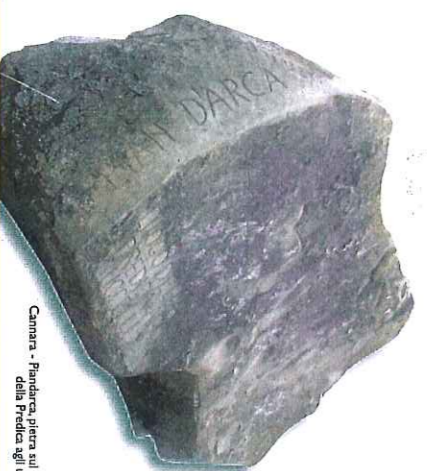
Cannara - Piantarca, piena sul luogo della Predica agli uccelli

Lasciato il castello, S. Francesco, insieme a fra' Masseo e fra' Angelo, si incamminò per un sentiero che da Cannara conduce a Bevagna: