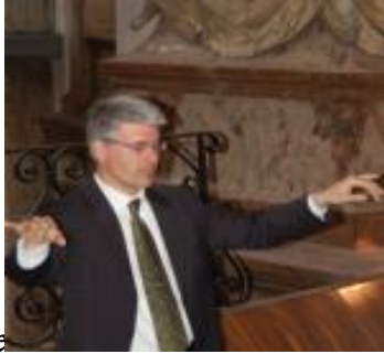
Collegium Vienna: Karlskirche

Nato nel 1966 a Milano ha coltivato fin da piccolo la passione per la musica corale e per organo.