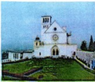
Basilica di S. Francesco

Partenza ore 7.30 da largo Preneste, angolo via Portonaccio arrivo ore 10 presso piazzale Basilica di S. Francesco di Assisi. La nostra gita partirà dalla basilica di S. Francesco con la voglia alternativa di ritrovare, nascosti in molti particolari costruttivi, i collegamenti storici esistenti fra Federico II, il ghibellino costruttore Padre Elia, grande estimatore dell'imperatore Caput Mundi e S. Francesco.