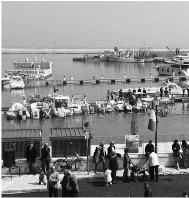
Il nuovo porto turistico

Infatti dalla cattiva azione amministrativa dei soggetti preposti possono derivare una serie di implicazioni sul patrimonio pubblico. A tal proposito viene indicato il decreto legislativo n. 231 dell'8 giugno 2001 che offre strumenti concreti per dare trasparenza alla stessa azione amministrativa e garan-