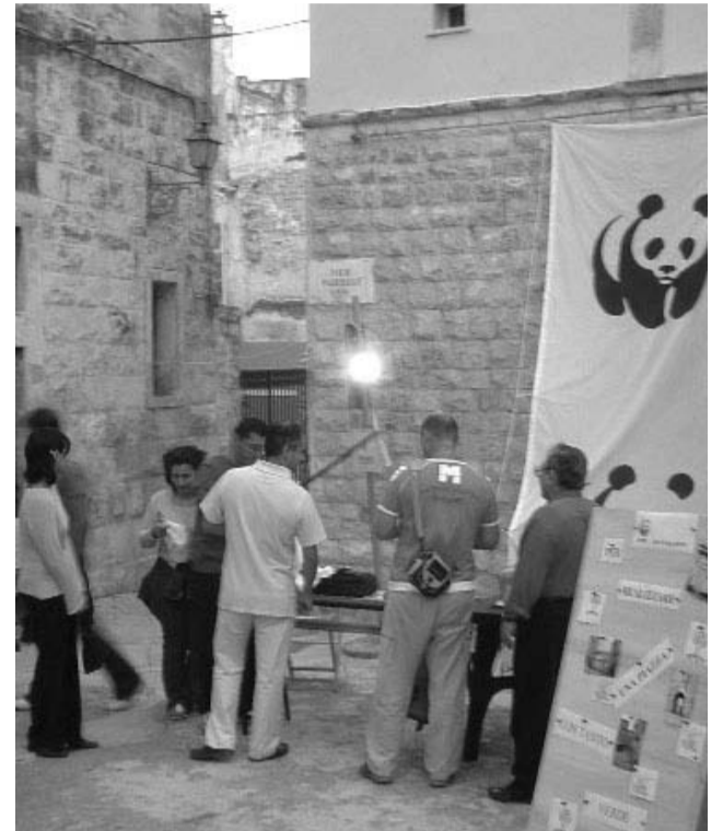
Un momento dell'iniziativa del Wwf

Tra le altre proposte l'istituzione di nuove aree verdi