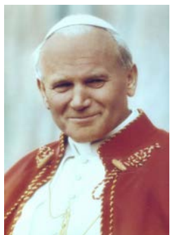
Giovanni Paolo II

Che il Beato Papa Giovanni Paolo II continui ad assisterci dal Cielo, e in modo speciale assista e illumini i suoi successori, Benedetto XVI, “ Benedetto colui che viene nel nome del Signore ”, e Papa Francesco, che deve condurre la nave nella grande tempesta