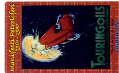
1870 e11/11 (Prima tessera quarta parte)