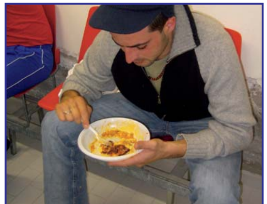
↑ Il Gattone si rifocilla in una delle mitiche "magnade"...