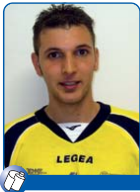
Tavolina sei brutto