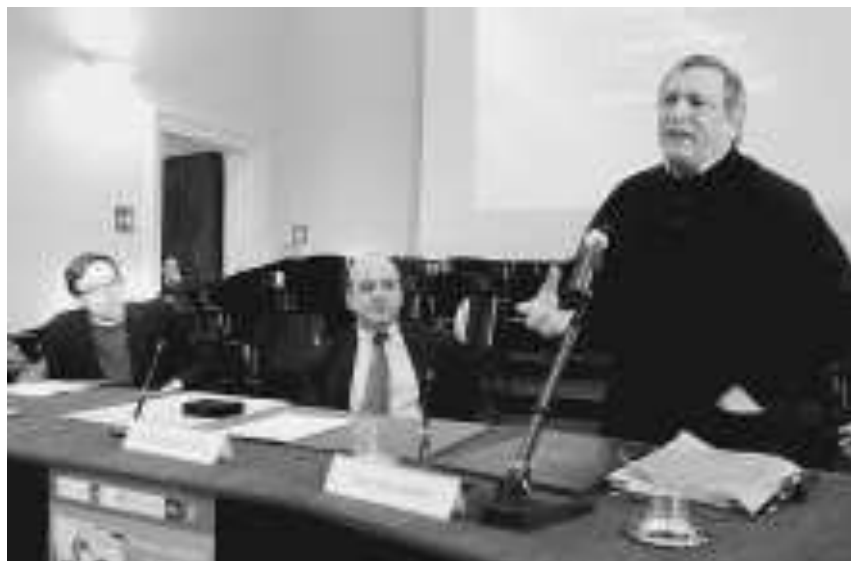
Varese, Nappi e al microfono don Ciotti durante l'iniziativa in ateneo

Il sacerdote, di fronte ad un folto pubblico, ha richiamato la 'lezione' di don Pino Puglisi, il prete del quartiere palermitano di Brancaccio ucciso dalla mafia. «Lui chiedeva la scuola per i suoi ragazzi - è stato il ricordo di don Ciotti - stava tentando di strapparli al loro destino fatto di strada e disperazione. E questo non poteva che attirare su di sé l'ostilità dei fratelli Graviano. Il suo orizzonte era quello fatto di educazione, cultura e rispetto reciproco». Un modo di combattere la criminalità organizzata ad ampio spettro, che don Ciotti fa suo senza se e senza ma: «La mafia - ha spiegato l'ani-