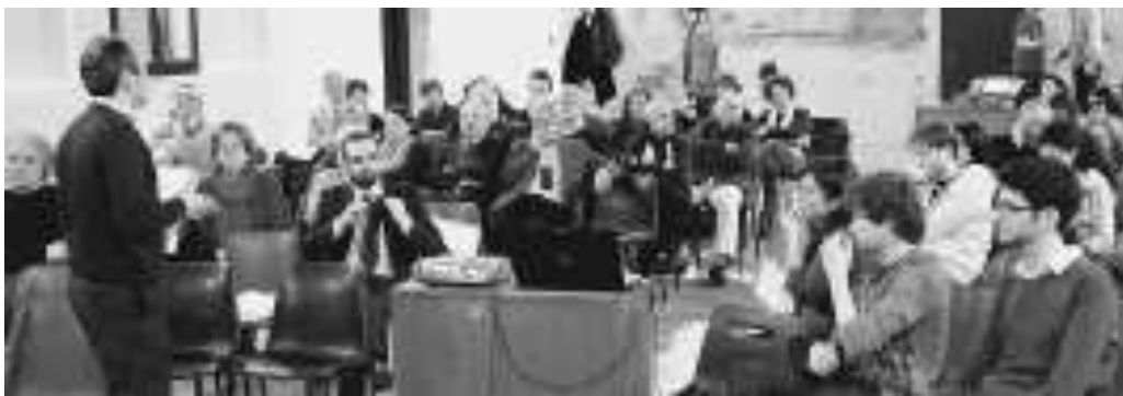
L'incontro della Fabbrica di Nichi in via Boccaleone

I Dibattiti cardiaci della Fabbrica di Vendola