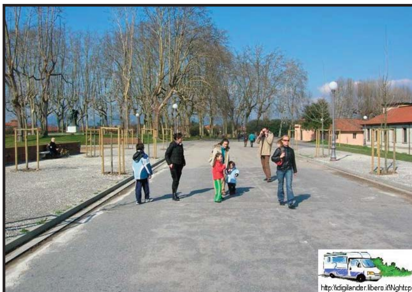
A spasso sulle mura di Lucca