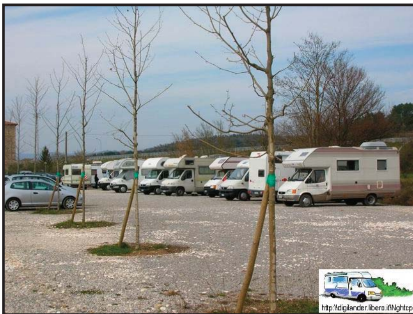
Parcheggio delle terme