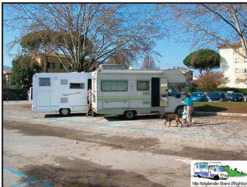
Sosta a Lucca