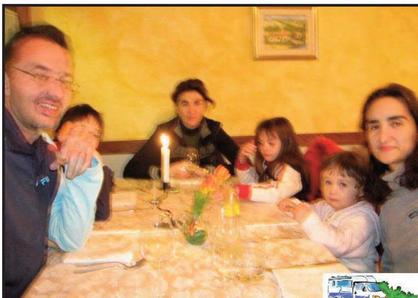
Cenetta a Montepulciano