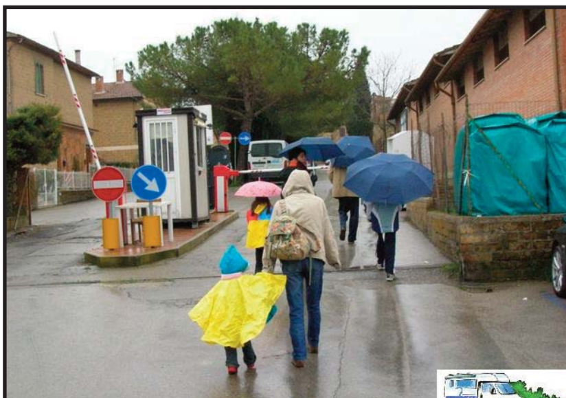
Pienza sotto la pioggia