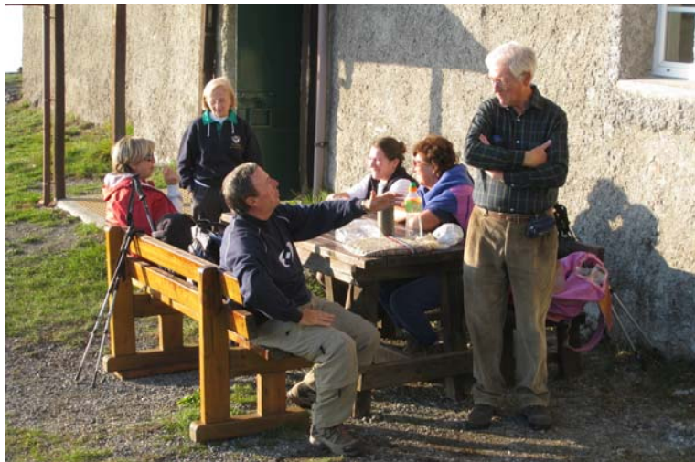
Pausa e quattro chiacchiere, davanti al rifugio...