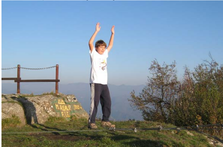
Salto della corda...