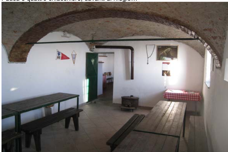
Interno, sempre tenuto in perfetto ordine... un plauso a chi lo cura così bene...