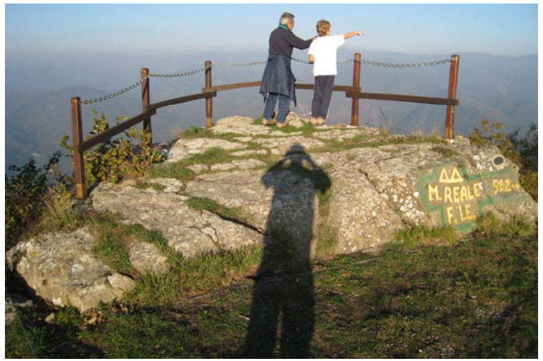
↑ Punto panoramico