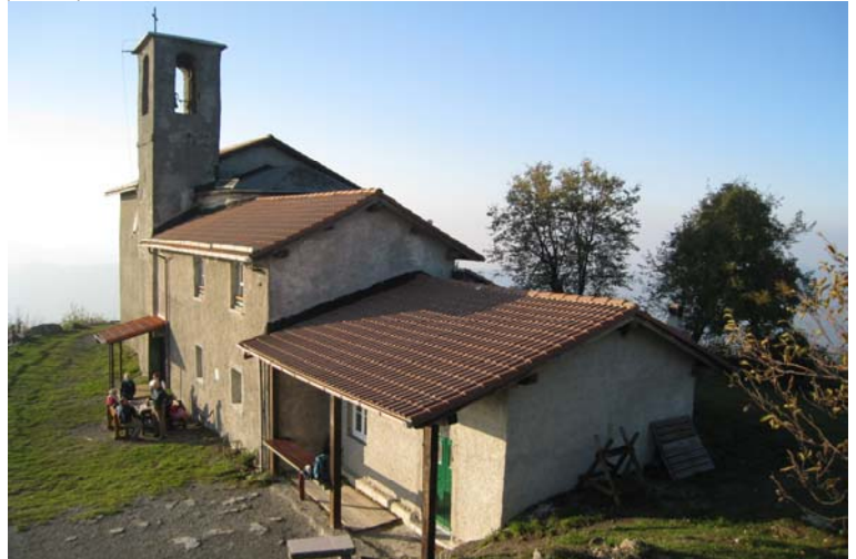
Chiesetta e rifugio