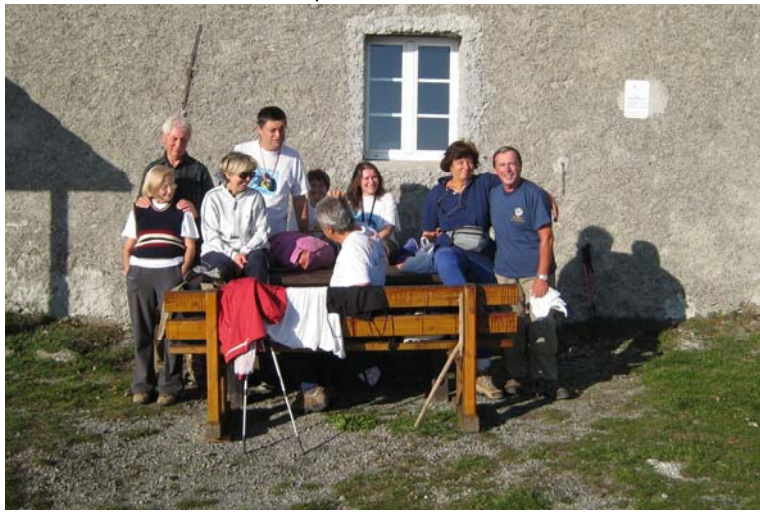
Da Cascine (500 m), frazione alta di Ronco Scriva, si sale in 1h (ad un passo escursionistico) con i due triangoli vuoti gialli, fino alla chiesetta del monte Reale (902 m)