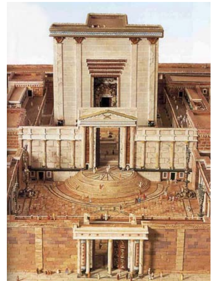
Figura 3 – Nella figura sono riportate due ricostruzioni del tempio di Gerusalemme. E' visibile l'edificio chiuso e coperto che conteneva il Santo e il Santo dei Santi, detto anche Santuario. Questo edificio era circondato da numerosi cortili aperti e da portici. Davanti al Santuario si trovava un grande Altare per i sacrifici. Lo spazio antistante il santuario era suddiviso nel cortile dei sacerdoti e nel cortile degli Israeliti, che si trovava più in basso, separato da una rampa di quattro gradini.