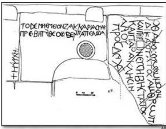
Figura 5 – Le tre iscrizioni greche ritrovate nella cosiddetta tomba di Assalonne a Gerusalemme. A sinistra, in verticale, la scritta ψυχή. Al centro, in orizzontale, l’iscrizione riguardante Zaccaria. In verticale, sulla destra, quella relativa al sacerdote Simeone che riconobbe Gesù come messia, contenente la citazione di Lc. 2:25.

è utile per stabilire se una simile tradizione fosse già nota nel I secolo e Gesù abbia potuto conoscerla.