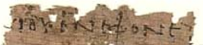
Figura 2 – Porzione del frammento di papiro P77 (fine II – inizio III sec. d.C.) rinvenuto a Oxyrhynchus. La linea contiene a sinistra una prima lettera danneggiata e solo parzialmente visibile, poi uno iota , una omicron ed una psilon che costituirebbero le ultime tre lettere di Βαραχίου (Barachia). Infatti sembra inverosimile che possano appartenere alla parola Ιωδαε (Ioiadà). Più a destra si leggono poi chiaramente le prime sei lettere del verbo ἐφορεύσατε (cfr. Matteo 23:35).

Ma San Girolamo (340-420 d.C. circa) nel Commento al vangelo di Matteo riporta che in un vangelo utilizzato dai Nazareni, un apocrifo oggi andato perduto e noto soltanto attraverso citazioni patristiche, il verso corrispondente a Mt. 23:35 conteneva “figlio di Ioiada” invece di “figlio di Barachia”: