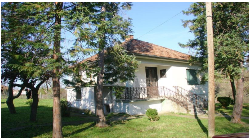
La palazzina che ospiterà la scuola materna.

varie sono le attività che abbiamo in corso, sia in Serbia che in Italia. Inizio con l'aggiornamento riguardante lo stato dei lavori presso la Scuola Primaria di Dragobrača , dove è in fase avanzata di ristrutturazione la casetta nella foto che ospiterà la scuola materna.