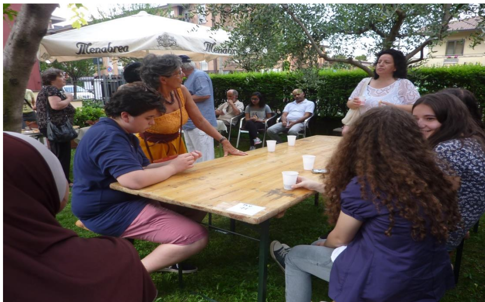
UN MOMENTO DELLA CONSEGNA DEI CONTRIBUTI PER LO STUDIO 2016

L' iniziativa si svolgerà alla fine di giugno – alla fine degli scrutini – in data e luogo ancora da decidere e che verranno comunicati successivamente.